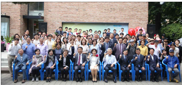
비영리법인(사회적협동조합)으로 조직변경 기념식