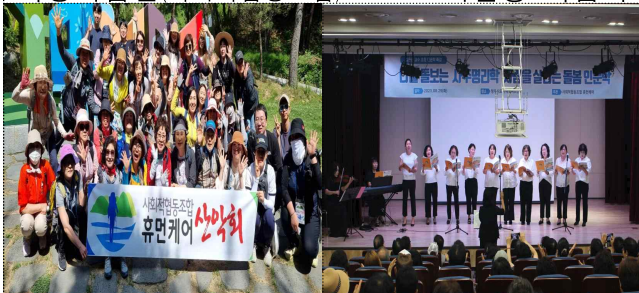
조합원 활동 활성화를 위한 소모임(산악회, 합창단)